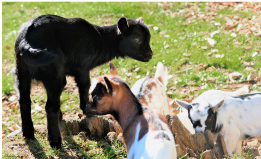
Nachwuchs bei den Zwergziegen im Tierpark Langenthal.

Das gleiche Schicksal wie Damhirsch Kurt ereilte Rothirsch Theo. Er wurde ebenfalls «aus dem Rudel genommen». Theo wurde durch einen sechsjährigen Junggesellen ersetzt – einem Geschenk des Tierparks Langenberg in